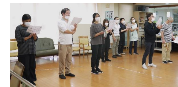
クリスマスに ちなんだ曲を 職員が合唱