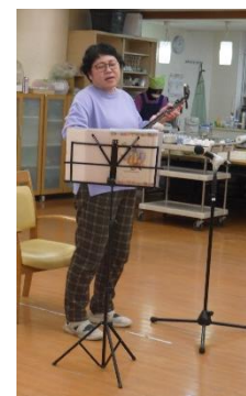
施設長による 唄と三線演奏