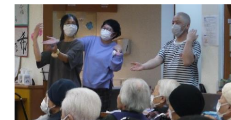
ズンドコ体操もみんなでノリノリ♪