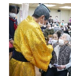
日本一暴れん坊な 將軍様というのは 仮の姿。 和やかに利用者様と 歓談していました。