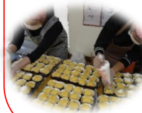
ケーキのデコレーションは 一つひとつ丁寧に