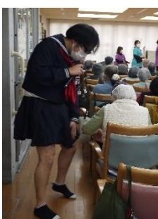
AKBもみんなで 踊りました♪