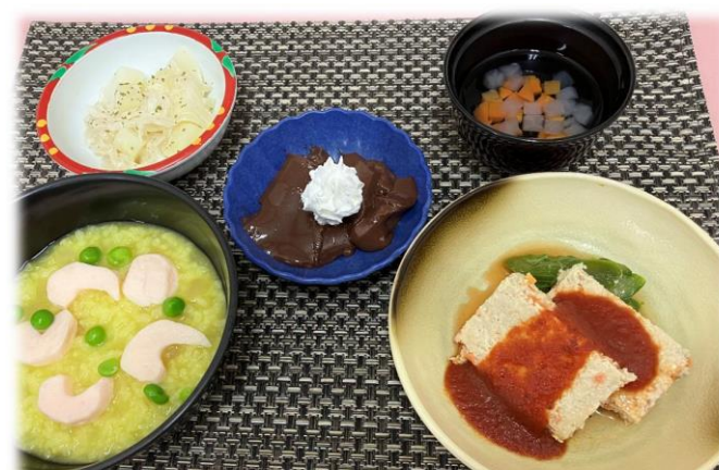
ソフトB食(歯ぐきでつぶせるやわらかさ)