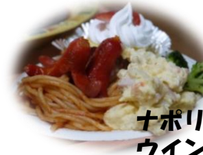
ナポリタンにはタコさん ウインナーをトッピング♪